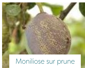
Moniliose sur prune