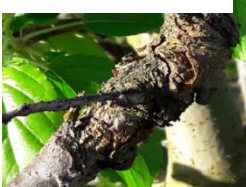
Chancre à nectria