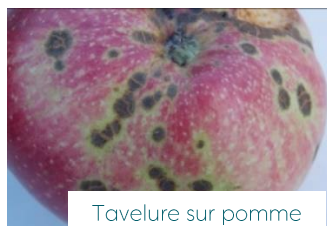
Tavelure sur pomme