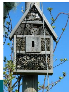
Petit hôtel à insectes

Les hôtels à insectes sont des aménagements qui permettent aux araignées et insectes utiles (auxiliaires, pollinisateurs...) de passer l'hiver ou de pondre en été. Ils complètent les abris naturels présents dans les jardins (tas de pierres, bois morts, troncs, souches ...).