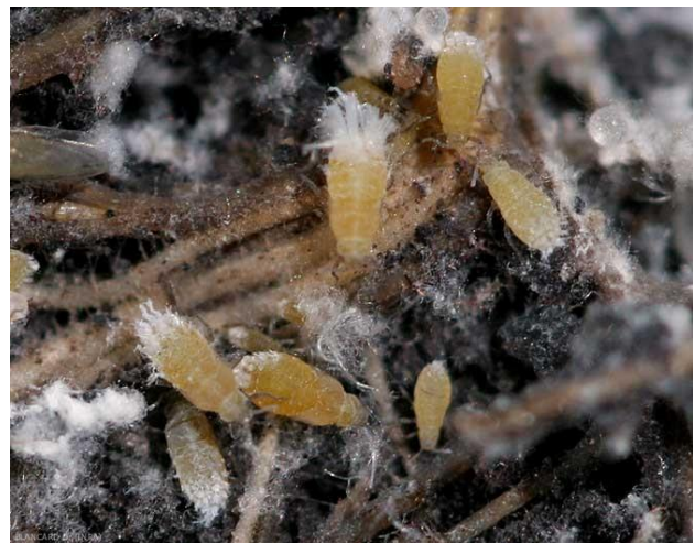
Colonies de pucerons lanigères des racines de laitue