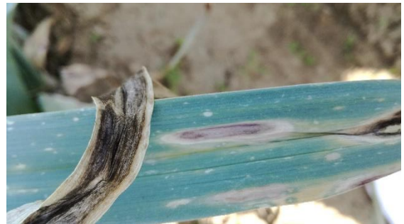
Tache d'alternariose en forme de losange sur feuille de poireau

L'alternariose provoque des taches plus ou moins ovales ou en forme de losange. Elles se recouvrent d'un feutrage brun, coloré de pourpre. Ce champignon se développe par temps chaud (+ de 20°C) et humide. Il se conserve dans les débris végétaux laissés au sol.