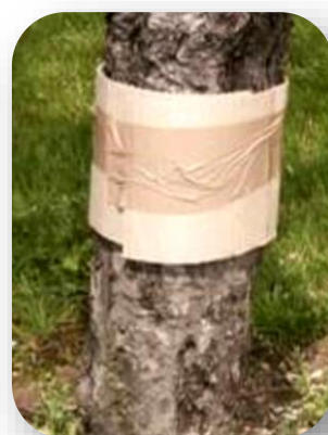
Bande piège cartonnée pour piégeage de chenilles de carpocapses