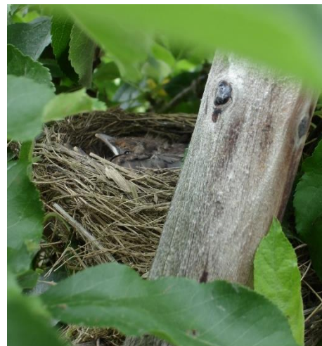
Nid dans pommier

Pour plus d'informations, vous pouvez consulter les dossiers du site https://ecophytopic.fr et https://www.jardiner-autrement.fr