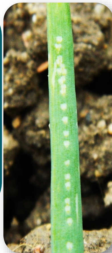
Mouche mineuse adulte et piqûres sur ciboulette