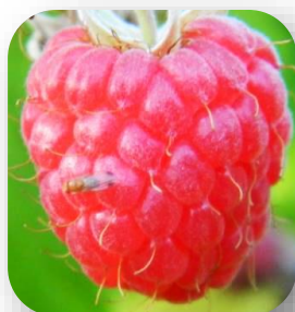
D. suzukii mâle sur framboise.

Lorsque les fraises et framboises remontantes apparaissent, les populations de D. suzukii sont souvent déjà importantes car elles ont pu se développer sur les fruits produits en juin et juillet (fraises, framboises, cerises, groseilles, ...). Les variétés tardives et remontantes sont donc très exposées aux attaques de ce ravageur. Seul un climat chaud et sec peut ralentir sa progression estivale.