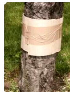
Bande piège cartonnée pour piégeage de chenilles de carpocapses