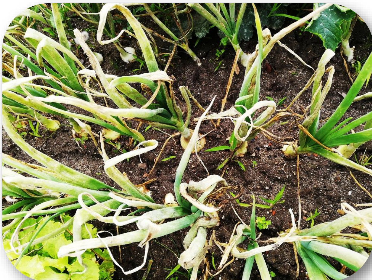
Dépérissement d'une parcelle d'oignon.

Dans un jardin du Loiret, plus de 90% d'une parcelle d'oignon présentait des signes de dépérissement. Les plantes accusaient un retard de croissance et le feuillage présentait des jaunissements avec des taches plus ou moins brunes.