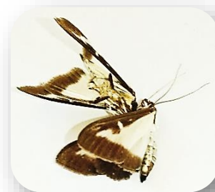
Photo : M. Rondelot, chef jardinier château d'Azay le Ferron. -captures de pyrales

Le vol se poursuit dans la région Centre Val de Loire sur tous les départements.