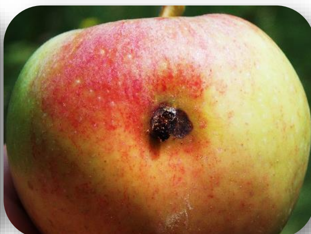
A gauche, papillon de carpocapse. A droite, dégât sur fruit