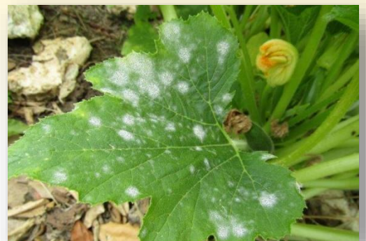
Taches d'oïdium sur courgette

Le champignon attaque surtout les feuilles, du début de l'été au début de l'automne. De nombreuses petites taches blanches et poudreuses s'étendent jusqu'à recouvrir toute la surface des feuilles, sur les deux faces. La végétation des plantes contaminées est ralentie et les feuilles se dessèchent rapidement. En conditions chaudes (23-26 °C) et sèches, les tiges et les pétioles sont également touchés et leur développement peut être arrêté. La maladie se propage essentiellement par le vent qui déplace les spores d'une plante à l'autre et se conserve l'hiver dans les débris végétaux laissés au sol.