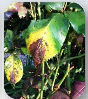
Taches sur feuillage