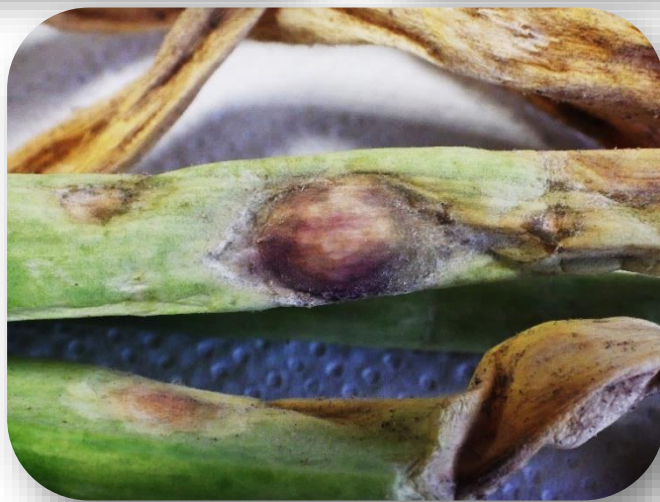
Présence de taches blanches et brunes sur le feuillage des oignons.