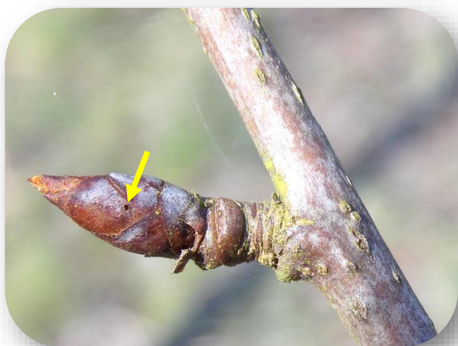
Bourgeon floral attaqué par Anthonomus pyri . Au printemps, le bourgeon a légèrement grossi et montre la trace de la piqûre de ponte.

A ce jour, il n'existe pas de méthodes alternatives pour réduire les populations d'anthonomes actuellement observables. En revanche, au printemps, si vous constatez la présence de larves dans les bourgeons, il est important de les éliminer pour éviter que la larve ne finisse son cycle et devienne ainsi adulte.