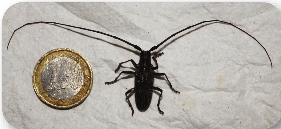
Monochamus galloprovincialis

A. glabripennis peut être éventuellement confondu avec des longicornes du genre Monochamus se trouvant sur des résineux, mais qui présente des élytres mats avec des taches aux contours flous et moins blanches que les capricornes asiatiques. De plus les antennes ne présentent aucune tache.