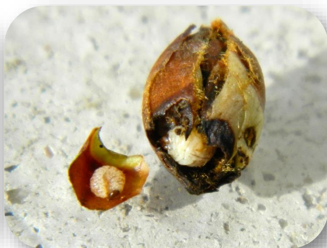
Larve d' Anthonomus pyri à l'intérieur d'un bourgeon.