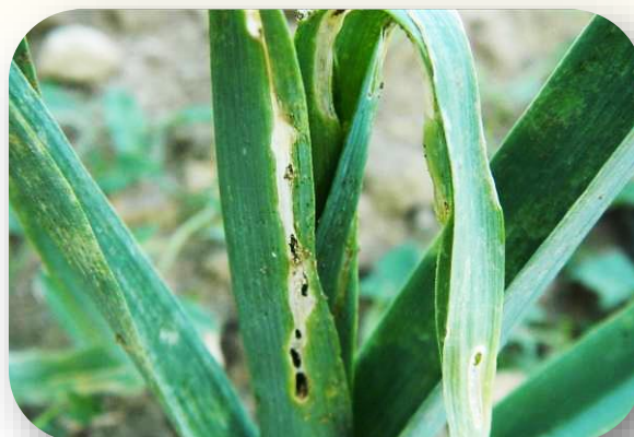
Dégâts de chenille sur poireau