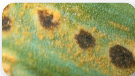
Dégâts de rouille sur poireau avec observations des pustules.