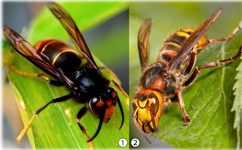
Frelon à pattes jaunes ①

Il se nourrit de pollen, de nectar, de fruits et d'insectes. Il est souvent confondu avec le frelon européen qui, en comparaison, a un abdomen jaune vif avec des bandes noires et des pattes marrons et est légèrement plus grand que le frelon à pattes jaunes.