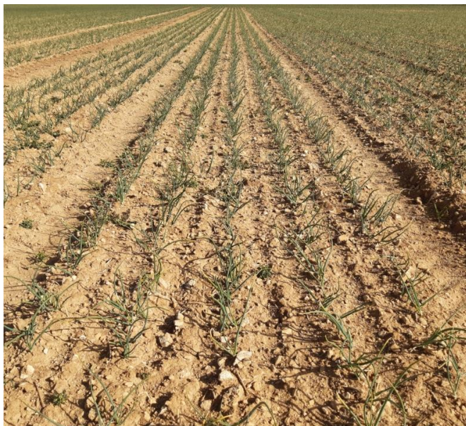
Parcelle de bulbilles (CA 14)

Bon état sanitaire des parcelles observées.