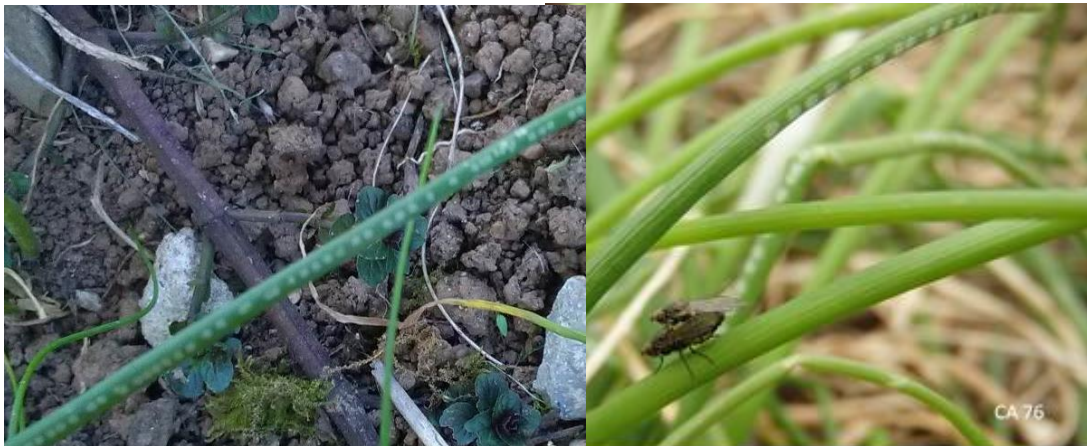
Piqûres de nutrition sur brin de ciboulette et accouplement

A cette période, les dégâts sur les jeunes plantules d' Allium se traduisent par la perte de plantules, leur affaiblissement et leur déformation.