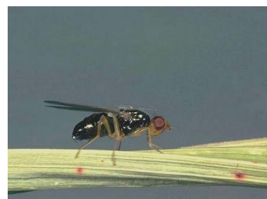
Adulte au repos.

La pose et le maintien d'un voile anti-insecte est recommandé pendant la durée du vol sur les cultures sensibles d'Apiacées.