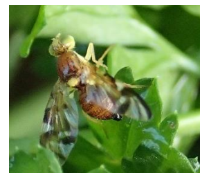
Mouche du céleri (SILEBAN)

Des captures de mouches du céleri ont été enregistrées dans les deux parcelles de persil situées en ex-Haute-Normandie.