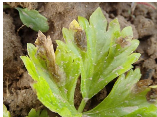
Galerie de mouche du céleri (Sileban)

Ce sont les asticots de la mouche du céleri qui creusent des galeries sur le feuillage. Une forte attaque peut être préjudiciable sur jeunes plants. Sur céleri branche, la présence de ces mines peut nuire à la qualité commerciale du produit.