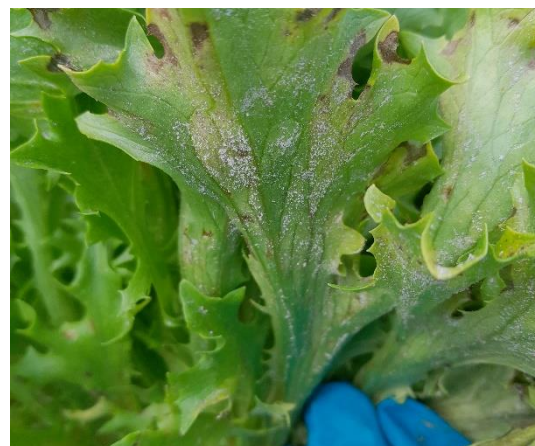
Taches de mildiou

http://ephytia.inra.fr/fr/C/5843/Salades-Biologie-epidemiologie