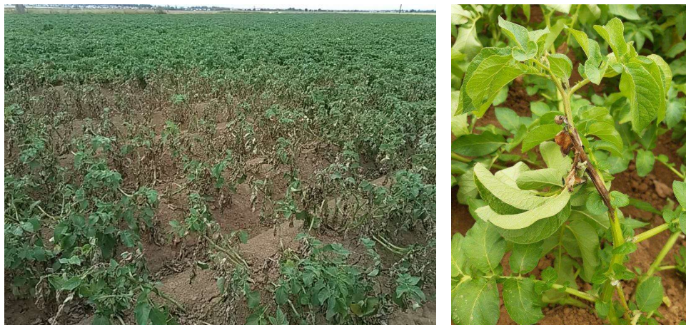
Foyer de mildiou et symptôme sur tige

Comme depuis quelques semaines, les conditions météo n'ont pas permis à la maladie de se développer.