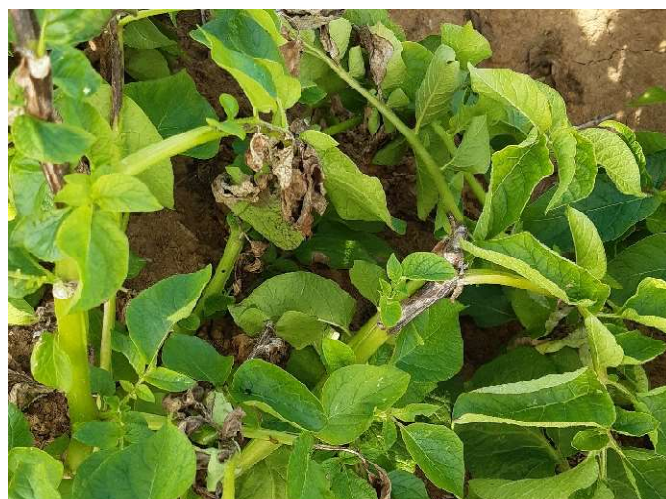
Tache de mildiou (Chambre d'Agriculture de Normandie)