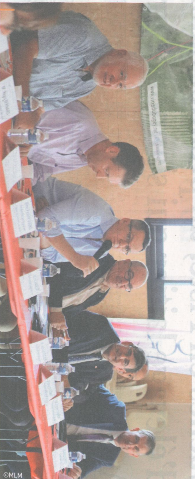
Les membres du bureau ont évoqué l'avenir des locaux de la plateforme Agrirural située à Belley afin que les travaux prévus aient bien lieu.

en 2020, les services de l'État ont établi un plan de lutte obligatoire auquel s'ajoute un programme de surveillance