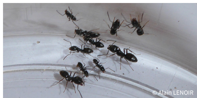
Polymorphisme des ouvrières de Tapinoma magnum

Souvent de petite taille, l'identification des fourmis exotiques invasives est difficile. Une observation de terrain n'est pas suffisante et l'avis d'un expert en laboratoire est nécessaire.