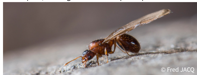
Reine Wasmmania auropunctata

étendues à ciel ouvert très ensoleillées. Elle est agressive (piqûre douloureuse) en cas d'attaque de la colonie. Wasmmania auropunctata , (voir l'encadré « fourmi électrique ») est originaire d'Amérique tropicale.