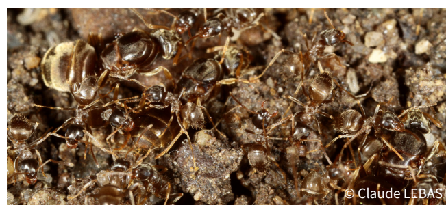
Lasius neglectus polygynes

À l'opposé des autres espèces citées plus haut, cette espèce préférera un environnement ombragé.