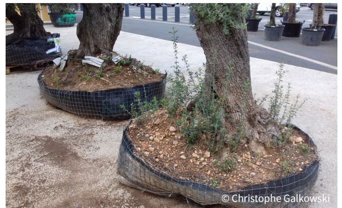
Oliviers contaminés par Tapinoma ibericum

Réalisez des contrôles réguliers à l'intérieur et aux abords des bâtiments et serres. Soyez en alerte au moment de la mise en pot des plantes, et avant leur transport.