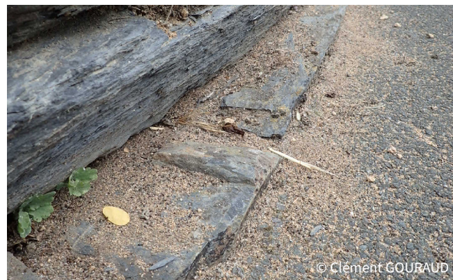
Excavation de sable causée par Lasius neglectus