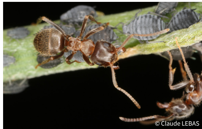
Elevage de pucerons par Lasius neglectus

Le genre Tapinoma est également friand d'invertébrés vivants ou morts et Lasius neglectus apprécie les déchets gras ou protéinés. Toutes ces espèces forment des supercolonies très fécondes.