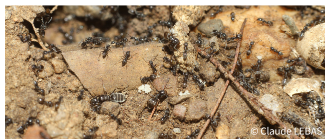
Nid de Tapinoma dariori

Toutes ces espèces se dispersent sur le territoire par bourgeonnement d'une colonie : une première fourmilière engendre une colonie fille en installant un autre nid à proximité dans lequel va se rendre une partie de la colonie