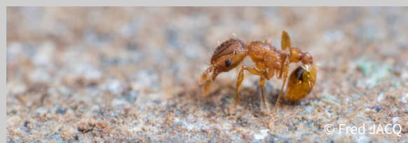
Ouvrière Wasmmania auropunctata

Wasmmania auropunctata est une petite fourmi jaune-orangé d'environ 1,5 mm. Facilement dispersable par le transport de plantes ou de déchets verts, Le mode de reproduction par clonage des mâles et des femelles lui confère son caractère très invasif. Elle est visible dans les serres dans lesquelles elle peut causer des dégâts sur les végétaux mais son principal impact négatif reste les réactions allergiques que peut engendrer sa piqûre très douloureuse (des cas de cécité sur animaux domestiques ont été rapportés). Elle constitue également une nuisance sur la faune locale par prédation ou compétition. Cette espèce a été observée pour la première fois en août 2022 dans le Var.