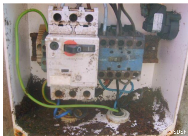
Compteur électrique et masses de fourmis électrocutées

Pour ce qui est des Lasius neglectus , leur impact est important sur les systèmes électriques (réseaux, installations, moteurs) qu'elles endommagent. En installant leurs nids contre ces sources de chaleur, elles créent de dangereux courts-circuits.