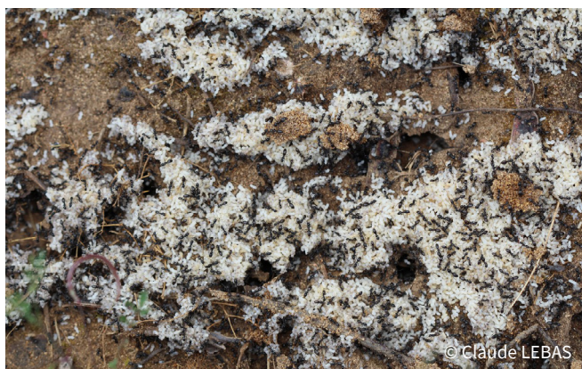
Nid de Tapinoma magnum

Plus récemment, c'est Tapinoma magnum qui est arrivée en France, dans les années 2000. Pour ce qui est de Tapinoma