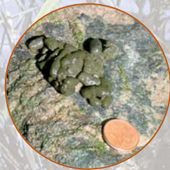
Crottes de Rat musqué