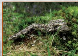
Epreinte (écaille, arête de poisson et reste de batracien enrobés de musc)

Indices de présences telles que coulées et terriers peuvent être confondus avec ceux du ragondin, qu'elle occupe fréquemment.