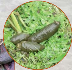
Crottes de Ragondin