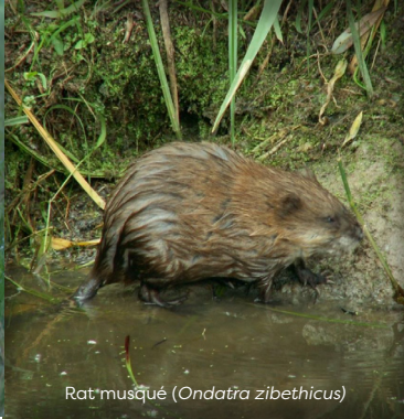
Rat musqué ( Ondatra zibethicus )

60 à 100 cm (queue comprise) Poids moyen : 6,4 kg