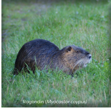
Ragondin ( Myocastor coypus )