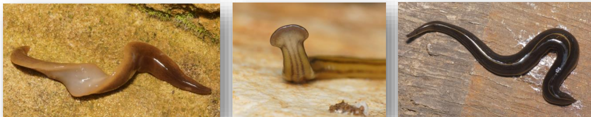
Photos : de gauche à droite, Obama nungara , Diversibipalium multilineatum , Platydemus manokwari

Localisation : Détecté uniquement dans les serres du jardin des plantes de Caen.