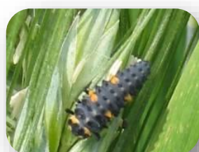
Larve de coccinelle