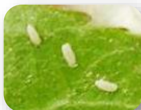
Œufs de syrphe