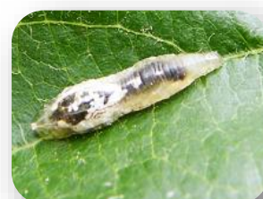
Larve de syrphe