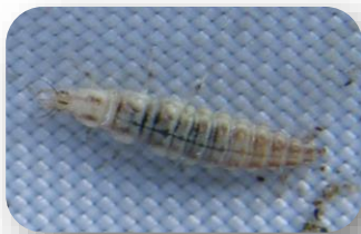
Larve de névroptère