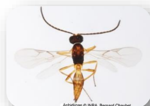
Braconidae (super famille Ichneumonoidea)