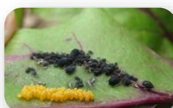
Œufs de coccinelle