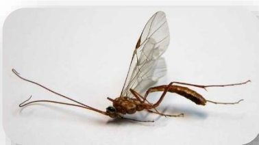
Ichneumonidae (super famille Ichneumonoidea)