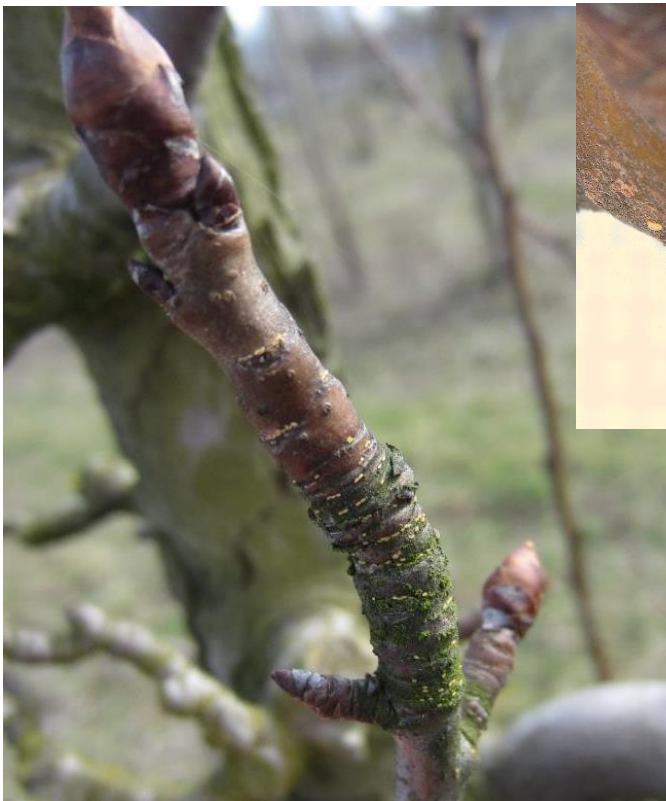
Pontes de psylles (0,8 mm) sur une lambourde

La présence d'œufs de couleur blanche a été observée sur le secteur de Brumath sur une parcelle en fin de semaine dernière. Ce sont des pontes récentes. Dans les autres secteurs, les conditions de brouillard et de givre n'ont pas permis les observations.