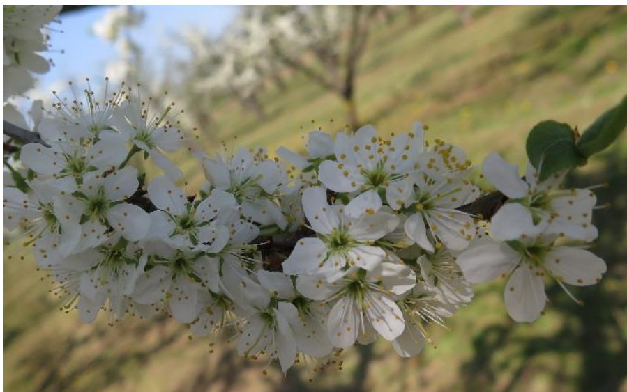
Pleine floraison sur mirabellier (AREFE)