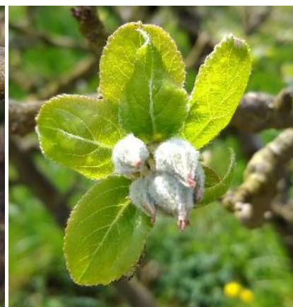
Eclatement des boutons floraux sur pommier (FREDON GE)