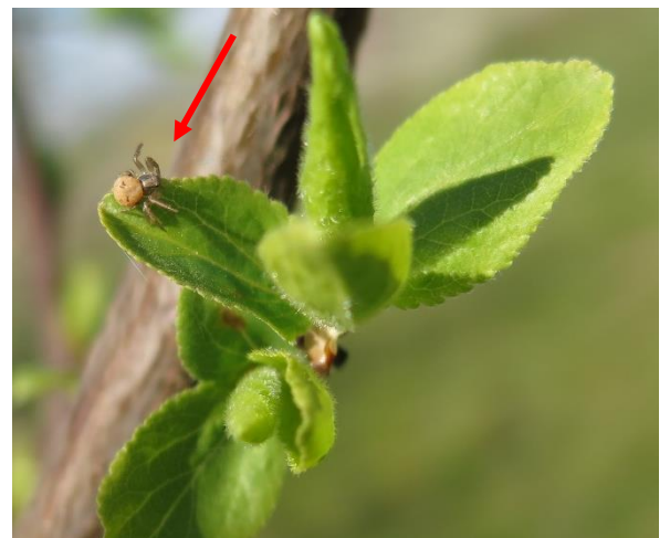
Araignée sur une pousse de mirabellier (AREFE)

Avec l'élévation de température depuis la semaine dernière, les conditions météo sont très favorables au développement de ce ravageur. Surveillez l'apparition des premiers foyers. Des auxiliaires ont déjà été observés sur certaines parcelles du réseau (coccinelles adultes, syrphes adultes et araignées). Ils peuvent permettre de réduire la pression.