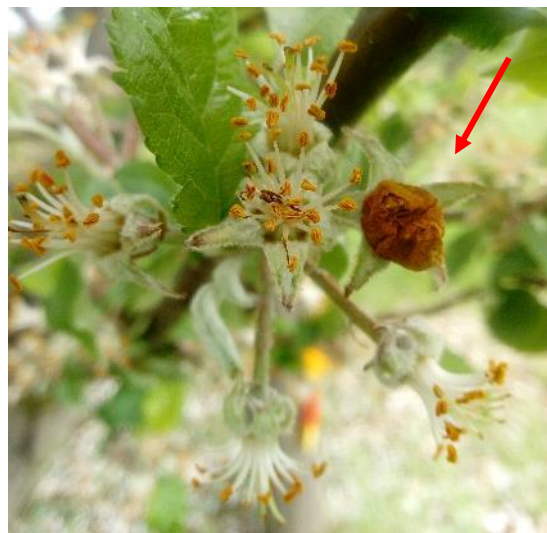
Fleur dite en « clou de girofle » (FREDON GE)

Le risque vis-à-vis de ce ravageur est terminé.