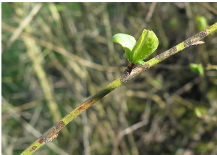
Taches de tavelure sur un rameau d'un an (AREFE)

La période de production des spores est en cours. Si les conditions sèches se poursuivent, la pression devrait être faible cette année .