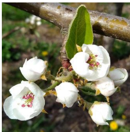
Premières fleurs sur poirier (FREDON GE)