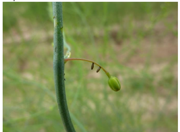
Œufs de criocères

Il existe un seuil à partir duquel il est risqué de laisser les populations se développer sur les stades juvéniles de l'asperge. Ce seuil est estimé à 3 criocères pour 10 mètres linéaires de rang (source Adar Blayais en Gironde).