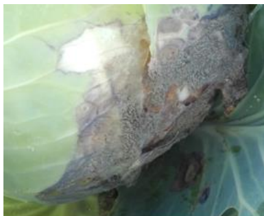
Botrytis (A. Claudel)