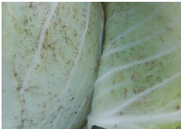
Dégâts de thrips (A. Claudel)

Les dégâts sont désormais bien visibles sur les variétés les plus tardives de chou à choucroute (Jubilée). Un nouveau vol a débuté, la hausse des températures et le manque de précipitations sont propice à leur multiplication.