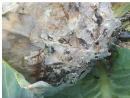
Sclerotinia (A. Claudel)