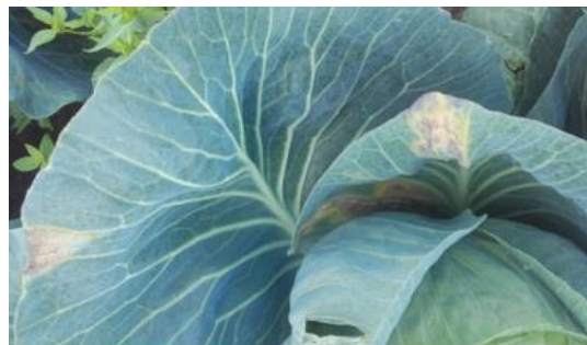
Xanthomonas (A. Claudel)