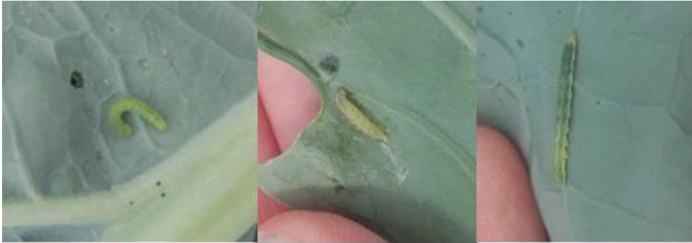
Larve de piéride de la rave à gauche, de teigne au milieu et de noctuelle à droite (A. Claudel)

La situation pour les chenilles phytophages peut varier d'un champ à l'autre, une surveillance régulière des parcelles est indispensable.