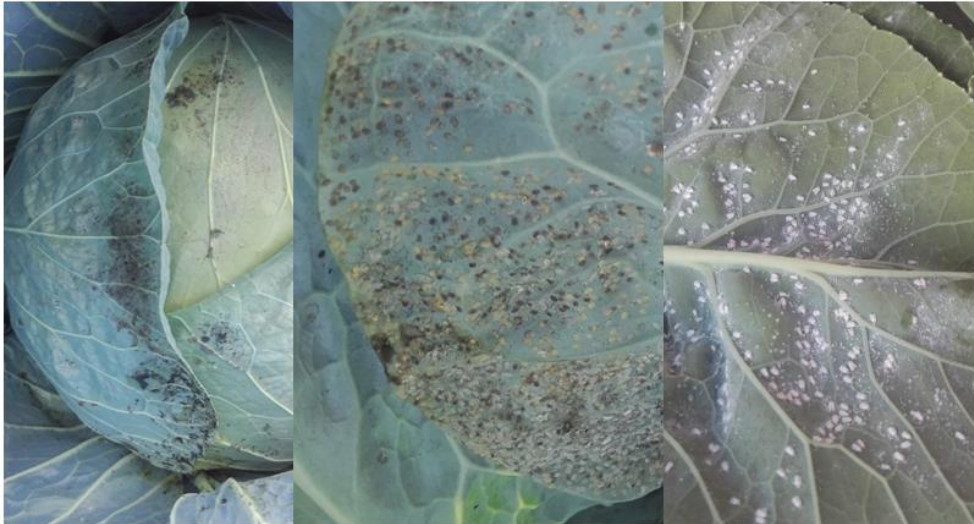
(Gauche) fumagine sur chou à choucroute, (milieu) aleurodes au stade larvaire, (droite) aleurodes adultes et pontes (A. Claudel)

Les températures chaudes et sèches sont propices à la multiplication du ravageur, on observe une hausse des populations dans les choux à inflorescence. Du miellat et de la fumagine sont constatés en grande quantité sur les feuilles externes des parcelles infestées depuis plusieurs semaines. Les aleurodes sont difficiles à maintenir sur les cultures sensibles.