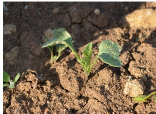
Dégâts d'altises sur semis (H. BEYER)

Les observations pour cette semaine ont été faites sur 3 exploitations sur les secteurs de Lunéville, Metz et Toul. La situation est globalement bonne pour les choux bien que les conditions redeviennent sèches et chaudes. Aucun foyer d'aleurode n'a été recensé cette semaine, et les chenilles défoliatrices restent peu observées dans les parcelles. Pour les semis de radis noir et de navet, les températures en hausse pourraient favoriser le retour des altises, bien que la pression soit relativement faible pour le moment.