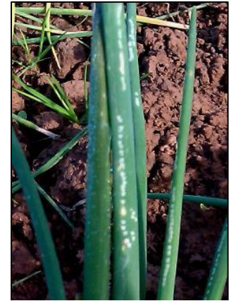
Piqûres de nutrition sur ciboulette. Technique classique et simple pour repérer le début du vol (H. BEYER)