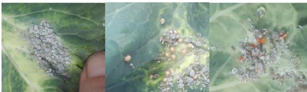
Foyer de pucerons cendrés à gauche, pucerons momifiés au milieu et cécidomyies prédatrices à droite (A. Claudel)

Pas de seuil de risque connu, les dégâts sont proportionnels à l'attaque et augmentent avec le temps.