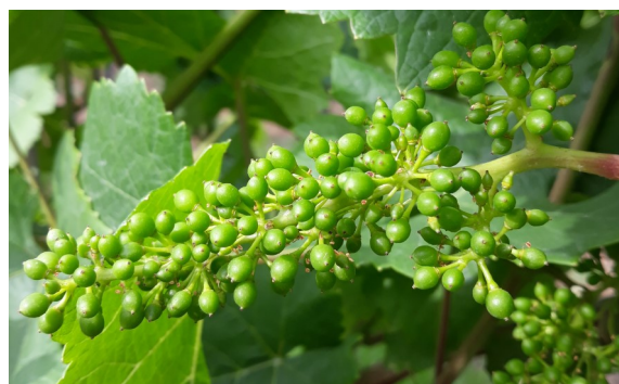
Grains de plomb

La coulure est constatée à présent dans une mesure acceptable.