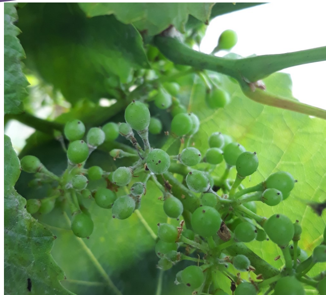
Symptômes sur grappe

La sensibilité persiste jusqu'au stade fermeture de la grappe.