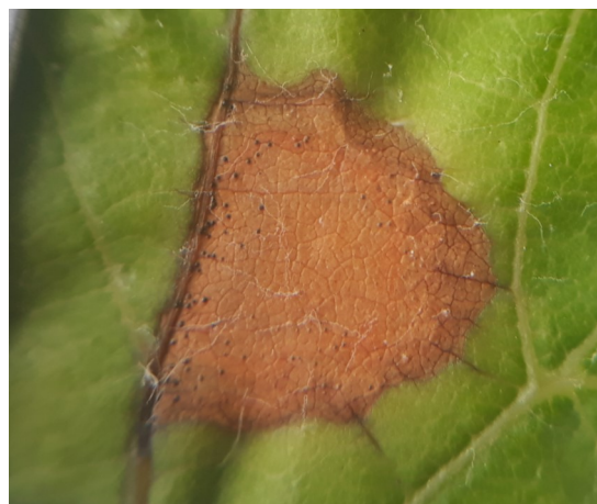
Tache de black rot

Ce bulletin est produit à partir d'observations ponctuelles réalisées sur un réseau de parcelles. S'il donne une tendance de la situation sanitaire régionale, celle-ci ne peut pas être transposée telle quelle à chacune des parcelles.