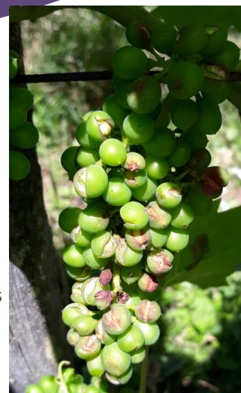
Grêle du 26/06 Mutzig