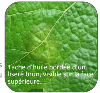
Tache d'huile bordée d'un liseré brun, visible sur la face supérieure.

La maîtrise du risque mildiou passe par une bonne prévention des prochaines contaminations. Les éléments à prendre en compte pour gérer le risque mildiou sont la pousse de la vigne, les cumuls d'eau, et les prévisions de pluie.