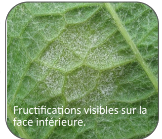
Fructifications visibles sur la face inférieure.