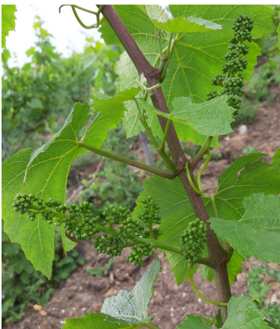
Les boutons floraux se séparent.

De nouveau, les températures ont joué au yo-yo depuis le dernier bulletin : après une semaine très douce, les températures sont nettement à la baisse depuis hier. Elles devraient remonter à partir de la fin de la semaine.