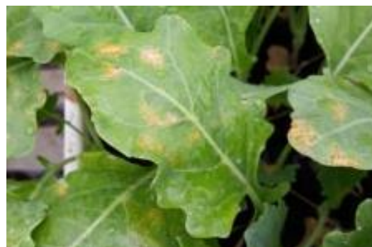
Début de mildiou sur jeunes plants de choux.

Il faut surtout éviter la propagation du mildiou aux autres plants potagers en isolant ou supprimant les plantes trop atteintes.