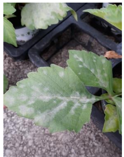
Tâches d'oïdium sur feuillage de dahlia

Les températures se rafraichissent et l'air est humide, ce qui peut favoriser le développement du champignon. Il faut surtout éviter la propagation de l'oïdium en isolant ou supprimant les plantes trop atteintes.