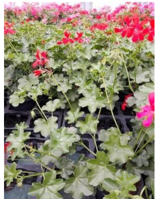
Pélargonium lierre.

Il faut cependant rester vigilant, les thrips peuvent facilement passer des géraniums aux jeunes chrysanthèmes lorsqu'ils arriveront. Le nettoyage des serres permettra d'éviter ce transfert.