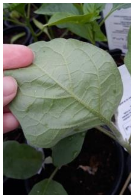
Foyer de pucerons sur la face inférieure de feuille d'aubergine

Comme précédemment, ces foyers peuvent encore être contrôlés par l'apport d'auxiliaires.