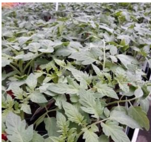
Dernières séries de tomates en production.

Les différentes séries de plants potagers continuent leur croissance. Les plantes sont globalement saines.