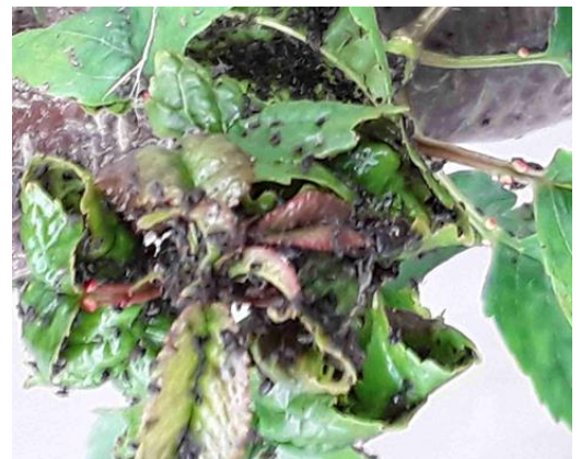
Colonie très importante de pucerons noirs sur cerisier

Les pucerons sont des ravageurs préoccupants pour les cultures. Dans certains, ils conduisent à des déformations de rameaux.