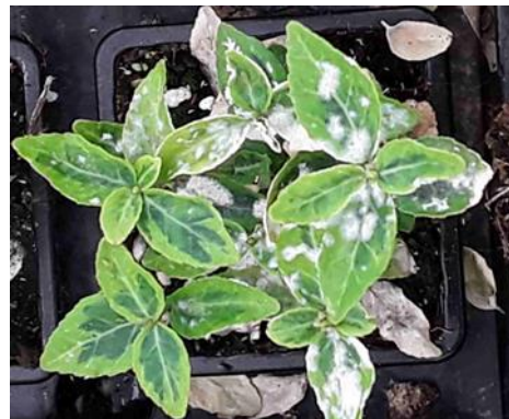
Oïdium sur jeunes fusains

Lorsque les plantes atteintes perdent leurs feuilles, le seuil de nuisibilité est dépassé.