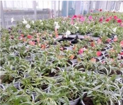
Dernières séries de calibrachoa et pétunias en croissance.

Les cultures sont fleuries et encore présentes en quantité en serres de commercialisation. En production, il reste quelques dernières séries en croissance pour la fin de saison.