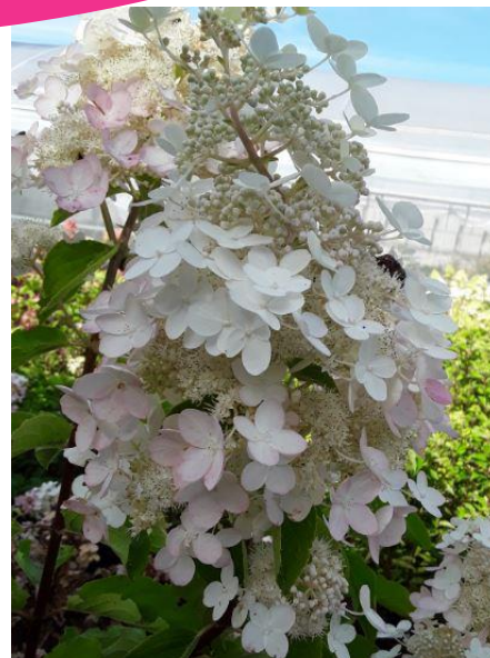
Inflorescence d'hydrangea paniculata

Pour les plantes sensibles, le risque est actuellement accru en relation avec l'amplitude thermique jour – nuit importante.