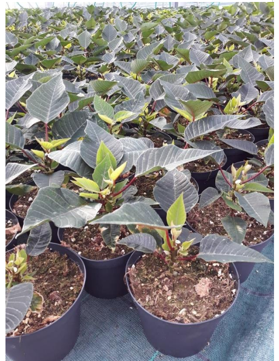
Poinsettias en croissance. Photo EH.

En ce début de culture, le risque est modéré. Il est cependant intéressant d'anticiper en mettant en place la Protection Biologique Intégrée.