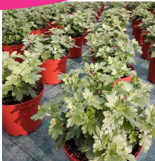
Croissance des chrysanthèmes.

Les chrysanthèmes poursuivent leur croissance. Les plantes sont globalement saines. Certaines variétés présentent un feuillage légèrement jaunissant. Le suivi de la fertilisation permettra de corriger d'éventuelles carences.