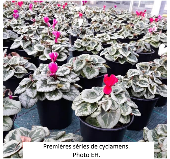
Premières séries de cyclamens.

Les cyclamens poursuivent leur croissance avec quelques difficultés : certains observateurs remarquent la présence de thrips, de chenilles de Duponchelia ou d'acariens. De plus les plantes ont souffert des fortes chaleurs des semaines passées, pour certaines plantes le feuillage jaunit et la croissance est ralentie. Les plantes de structures : carex, sédums, calocéphalus, heuchères... sont progressivement repotées et globalement saines.