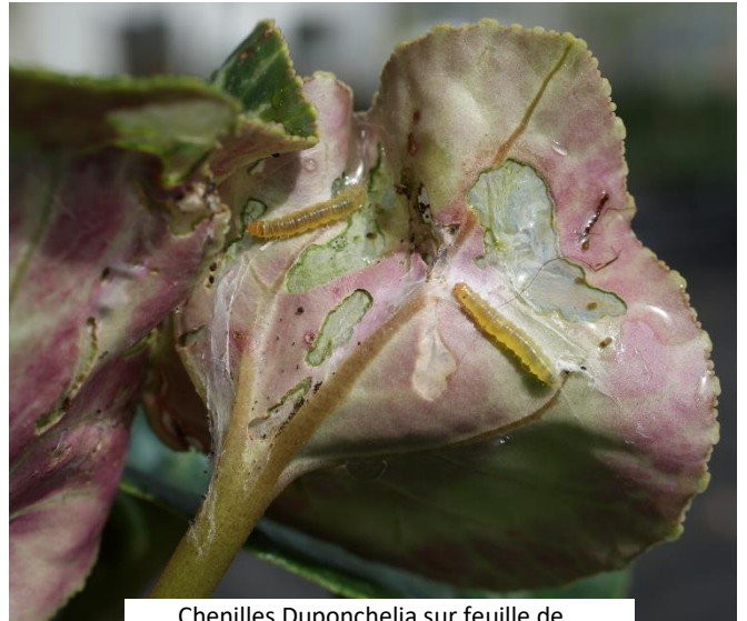
Chenilles Duponchelia sur feuille de cyclamen.

Duponchelia apprécie tout particulièrement cette culture. La chenille engendre des dégâts sur le feuillages mais peut également blesser les racines et le bulbe. Ces blessures favorisent alors l'arrivée des maladies telles que la fusariose.