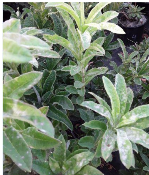
Oïdium sur feuilles d'azalée

Ce bulletin est produit à partir d'observations ponctuelles réalisées sur un réseau de parcelles. S'il donne une tendance de la situation sanitaire régionale, celle-ci ne peut pas être transposée telle quelle à chacune des parcelles.