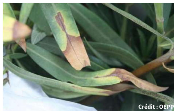
Symptômes sur cerisier à gauche et sur laurier rose à droite