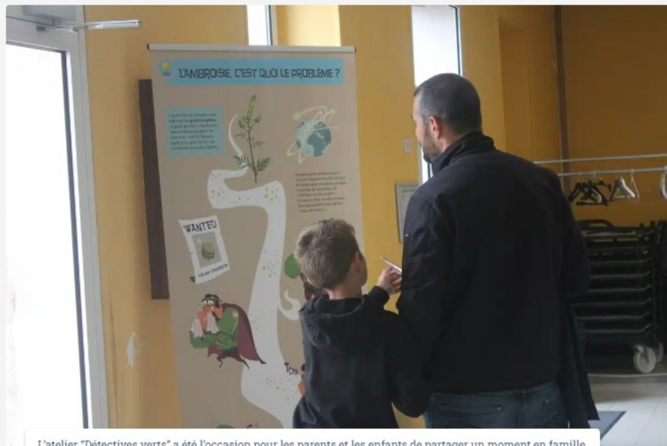
L'atelier "DéTECTIVES VERTS" a été l'occasion pour les parents et les enfants de partager un moment en famille.