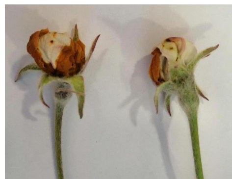
Symptômes de clous de girofle renfermant une larve d'anthonyme

Les premiers symptômes de fleurs en forme de clous de girofle ont été observés sur une parcelle du réseau. A l'intérieur, il est possible de voir une larve qui se développe.