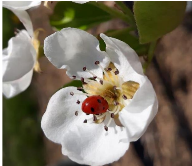
Coccinelle adulte sur fleur

http://www.ecophytopic.fr/tr/méthodes-de-lutte/biocontrôle