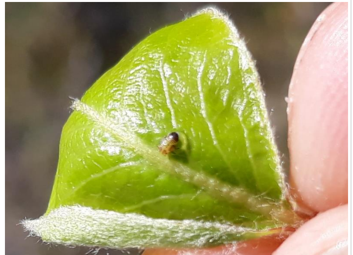
Jeune larve de psylle

Cette semaine, 9 parcelles de poirier ont été observées dont 1 avec absence de psylles. Dans les 8 autres parcelles, la présence de psylles varie de 1 à 4 larves sur 25 lambourdes. 2 parcelles sur 9 sont au-dessus de 10% des lambourdes occupées. Le stade majoritaire est celui des jeunes larves jaunes. Les conditions sont très favorables à l'activité du psylle.