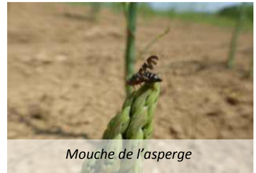
Mouche de l'asperge

Le vol touche à sa fin. Quelques dégâts sont visibles sur des parcelles, mais plutôt faibles, exceptées quelques parcelles fortement touchées.