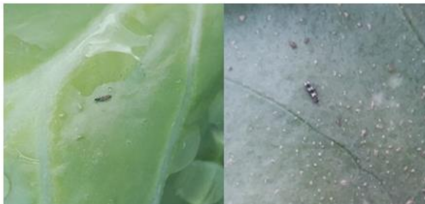
Thrips adulte à gauche, Aleothis (auxiliaire) à droite (A. Claudel)

Liste des produits disponibles sous https://info.agriculture.gouv.fr/gedei/site/bo-agri/instruction-2020-110