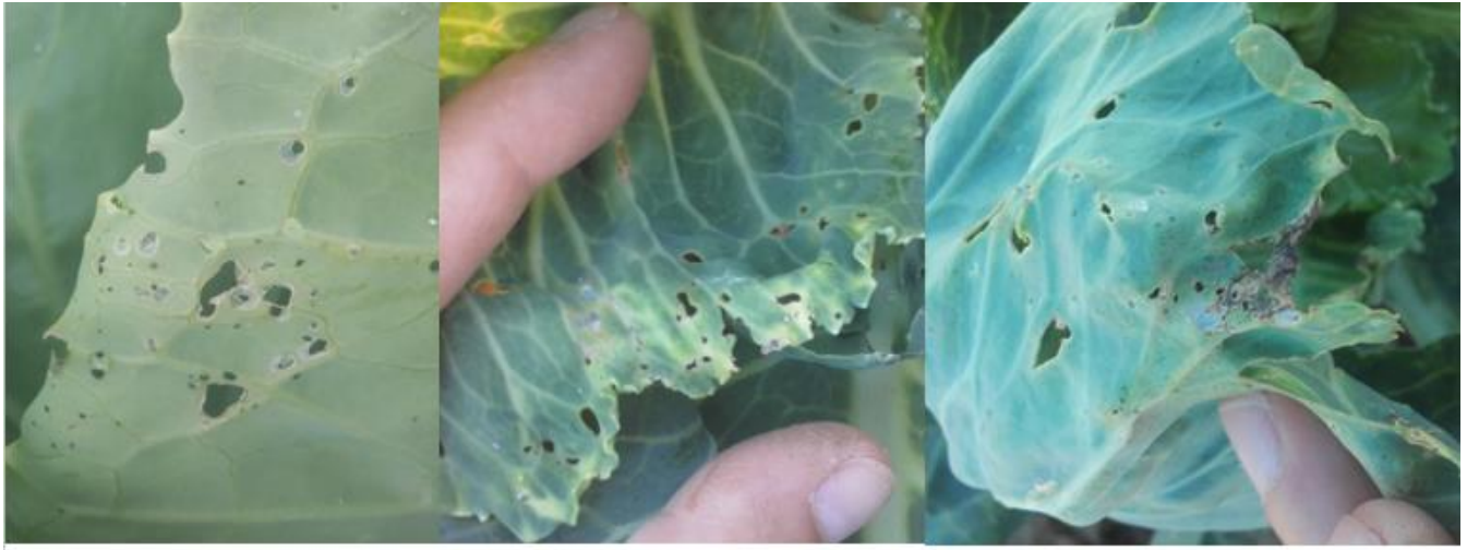
Dégâts de charançon gallicole (A. CLAUDEL)