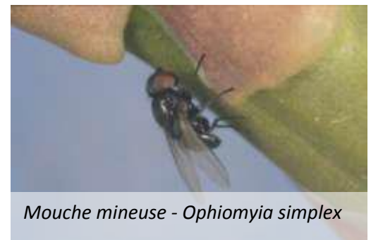
Mouche mineuse - Ophiomyia simplex

Quelques dégâts commencent à se faire voir comme des dessèchements de pieds. Mais souvent sans trop d'incidence. Pas de seuil défini.