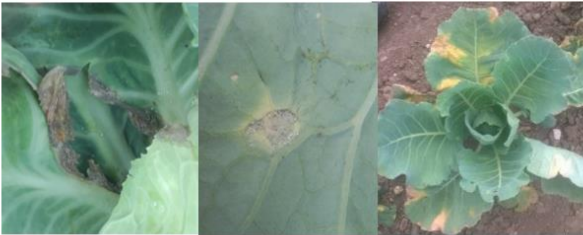
Botrytis à gauche, mildiou au milieu et Xanthomonas à droite (A. Claudel)