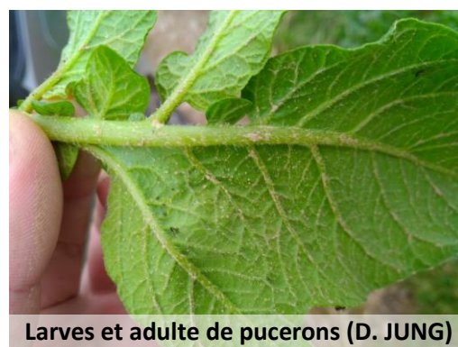
Larves et adulte de pucerons (D. JUNG)

Aucune méthode alternative efficace. Pour la production de plants, des huiles sont utilisables (également certaines en AB).