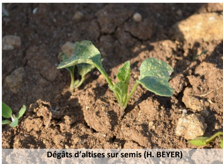
Dégâts d'altises sur semis

Les observations sur crucifères pour cette semaine ont été réalisées sur trois sites sur les secteurs de Toul, Nancy et Lunéville. Aucun foyer de puceron n'a été observé, et peu d'altises sont présentes sur les choux bien que les dégâts soient parfois importants. Quelques aleurodes sont également observés, mais la pression reste faible.