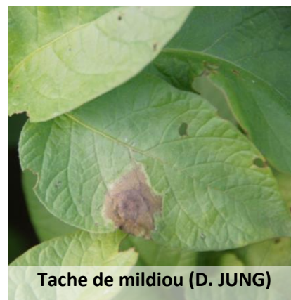
Tache de mildiou (D. JUNG)

Le modèle Mileos® d'Arvalis Institut du Végétal permet la modélisation du risque de la maladie selon la sensibilité variétale du feuillage en fonction des contaminations et des sporulations suivantes). Il faut que la parcelle ait atteint les 30 % de plants levés pour prendre en compte le risque mildiou.