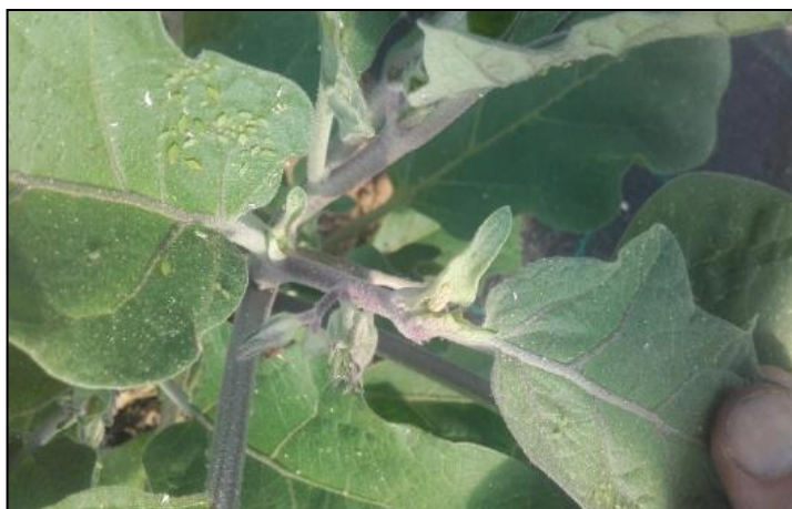
Colonie en développement de pucerons verts sur aubergine (H. BEYER)

Le risque reste globalement moyen , mais il est variable d'un site à l'autre selon la culture considérée et le niveau de développement des auxiliaires.