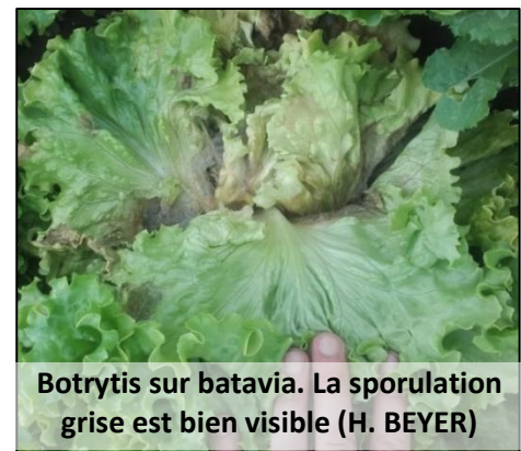
Botrytis sur batavia. La sporulation grise est bien visible

Les infections par le botrytis sont favorisées par une forte fertilisation azotée ainsi que par les blessures (y compris des pucerons) qui sont des points d'entrée de la maladie. L'espacement des têtes (10/m 2 au lieu de 12 ou 14) permet d'améliorer la ventilation de la culture et de diminuer la pression. La plantation sur plastique isole les feuilles du sol ce qui limite aussi l'infection.