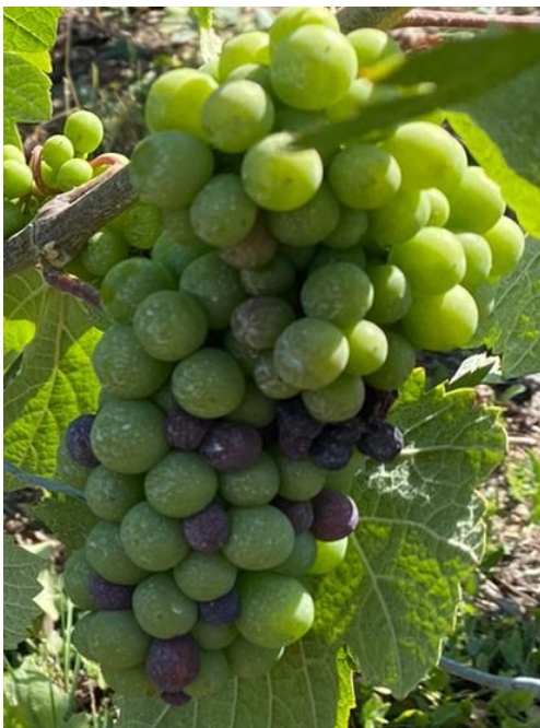
Premières baies vérees.

Les grappes sont maintenant bien fermées, voire compactes. Comme souvent à ce stade, du « cochonnage » (baies expulsées, ramollies, parfois colorées) commence à être visible. Quelques baies vérees sont aussi signalées au vignoble depuis le début de la semaine, mais elles restent encore rares.