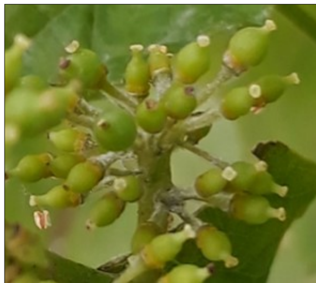
Les symptômes oïdium à rechercher - BSV viti Alsace

Le palissage soigné, l'aération de la zone des grappes, l'effeuillage sur la face coté soleil levant sont des mesures prophylactiques permettant de limiter la pression oïdium.