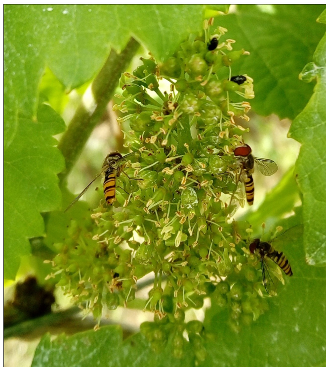
Syrphes sur fleurs au 15/06 Amélie MARI (FREDON GE)