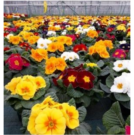
Allure générale des primevères.

Les cultures de printemps, pensées et primevères, sont prêtes à la vente. Les cultures sont globalement bien développées et fleuries cependant des foyers de pucerons s'y développent depuis plusieurs semaines. Ces foyers de pucerons représentent un risque fort, non seulement pour les bisannuelles en phase de commercialisation, mais également pour les jeunes plants tout juste arrivés en entreprise, qui peuvent être colonisés.