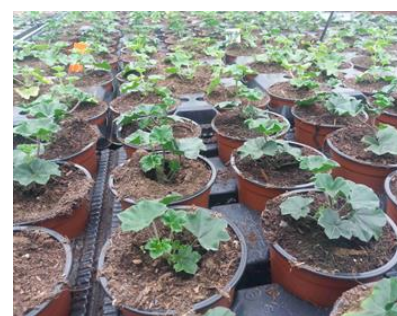
Vue d'ensemble d'une culture de pélargonium.

A ce stade, rares sont les pucerons identifiés dans les cultures.