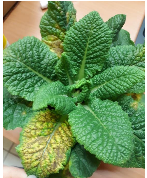
Primevère atteinte de ramulariose.

Peu de risques pour les plantes. Il est possible de retirer les feuilles trop atteintes pour éviter l'installation d'autres champignons comme le botrytis.