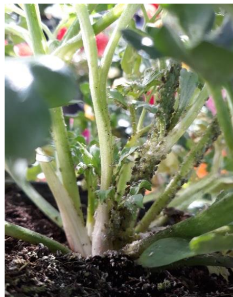
Foyer de puceron au cœur d'une renoncule.

Risque actuellement élevé, identifier et isoler les plantes atteintes.