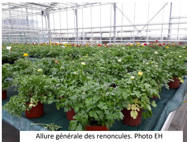
Allure générale des renoncules.

D'autres bisannuelles de printemps sont en cours de floraison dans les serres des producteurs : renoncules, pâquerettes. Le développement des plantes et leur état sanitaire est plutôt bon. Comme pour les pensées et primevères, attention cependant au développement de foyers de pucerons.