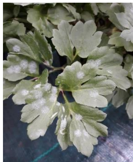
Tâches d'oïdium sur feuillage de renoncule.

Le risque est modéré en cas de foyer très localisé. Isoler la plante car le champignon se propage très rapidement.