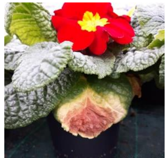
Botrytis sur feuille de primevère.

Risque modéré pour le moment, le champignon se développe surtout si les conditions culturales sont trop humides. Le risque peut devenir fort si les primevères et pensées ont fleuries tôt, à cause des températures plutôt chaudes de cet hiver. Certaines fleurs sont alors en train de faner, il faut rapidement nettoyer les plantes avant l'installation et le développement du botrytis.