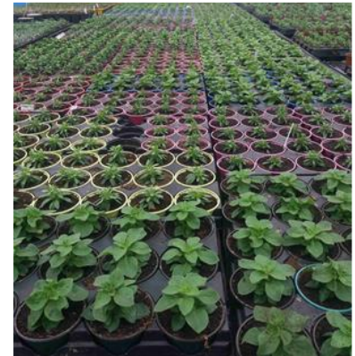
Vue d'ensemble - plantes de diversification.

Sous les serres de multiplication, en conditions chaudes et humides, le risque de présence des sciarides est très important. La présence de fertilisation organique dans les substrats renforce ce risque.