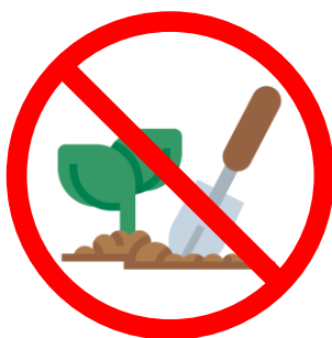
Ne pas planter des plants malades