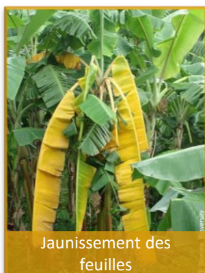
Jaunissement des feuilles