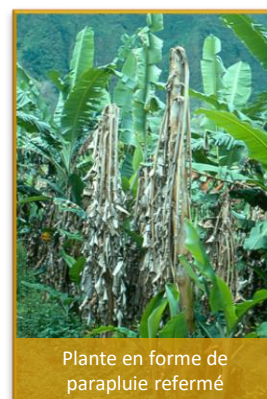
Plante en forme de parapluie refermé