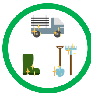
Nettoyer son véhicule, ses bottes et ses outils