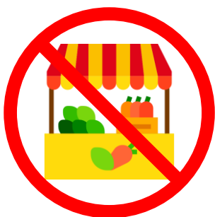
Ne pas vendre ses fruits