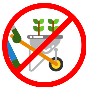
Ne pas déplacer les plantes