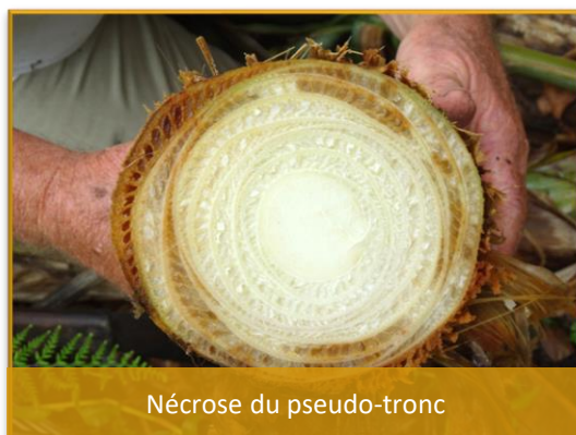
Nécrose du pseudo-tronc