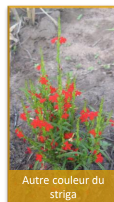
Autre couleur du striga