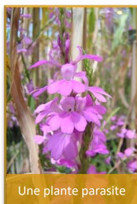
Une plante parasite