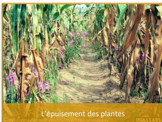
L'épuisement des plantes