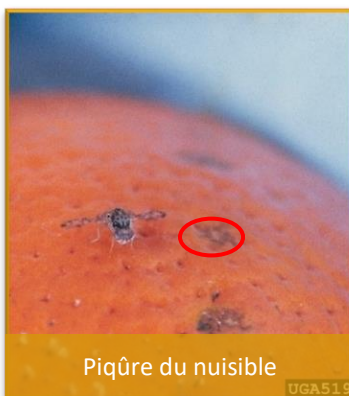
Piqûre du nuisible

Lien : http://www.alimea.fr/ph_ladifference08.html