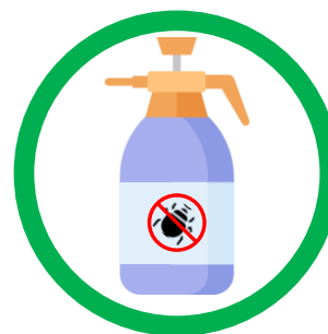
Traiter avec des insecticides