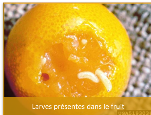
Larves présentes dans le fruit