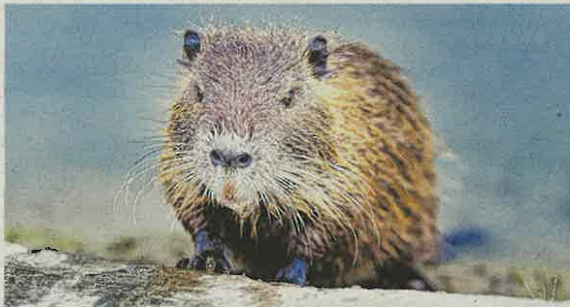
Le rat musqué et le ragondin (photo) occasionnent des dégâts importants aux cultures, aux infrastructures hydrauliques et routières.

de-France et les groupements opérateurs encouragent l'ensemble des piégeurs et des acteurs de la lutte contre les rongeurs aquatiques envahissants à intensifier leurs actions de lutte contre ces espèces en février/mars, en amont et au début de la période de reproduction du rat musqué.