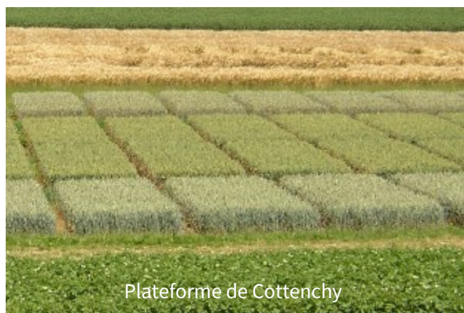
Plateforme de Cottenchy