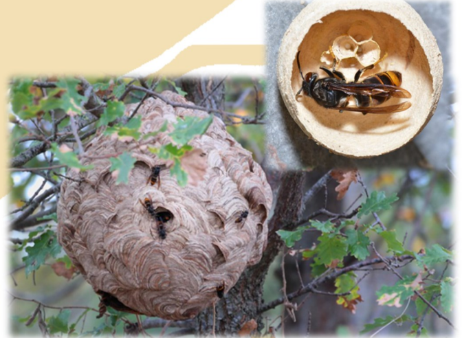
Nid secondaire