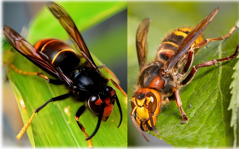
Frelon à pattes jaunes Frelon européen

Il se nourrit de pollen, de nectar, de fruits et d'insectes. Il est souvent confondu avec le frelon européen qui, en comparaison, a un abdomen jaune vif avec des bandes noires et des pattes marrons et est légèrement plus grand que le frelon à pattes jaunes.