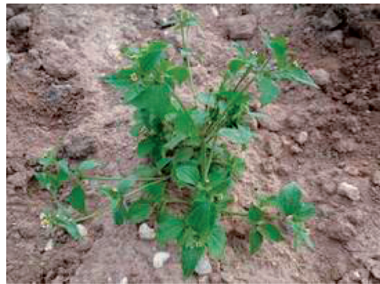
Galinsoga cilié. Plante entière