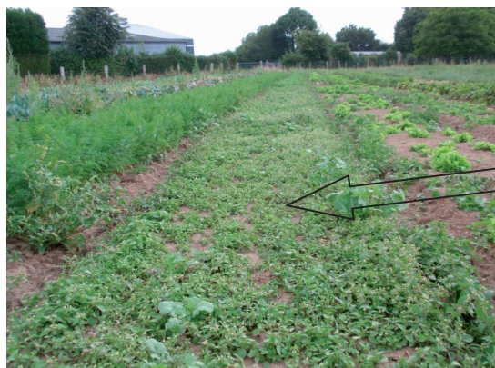
Colonie de galinsoga

En résumé, la plante est redoutable par sa capacité à former de grandes colonies en peu de temps, les champs pouvant rapidement être recouverts par le galinsoga. Il peut former des colonies très denses sans se nuire à lui-même mais le nombre de graines produites diminue alors.