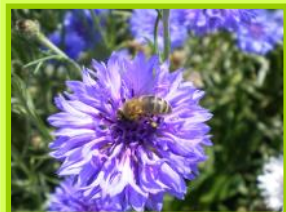
Le Centaurée bleuet est un exemple de plante attractive

*Refuge étudié dans le cadre du programme Interreg III Nord Pas-de-Calais/Kent « Transorganic », programme de collaboration franco-britannique de 2005 à 2007 soutenu par l'Union Européenne (FEDER) et le Conseil Régional du Nord Pas-de-Calais. Le partenariat associait la FREDON au travers de sa Station d'Etudes sur les luttres Biologique, Intégrée et Raisonnée ; East Mailing Research (EMR) et le Groupement des Agriculteurs Biologiques du Nord Pas-de-Calais (GABNOR)