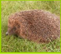
Le hérisson mange les limaces

Les animaux « auxiliaires » rendent beaucoup de services au jardinier. Une de leurs actions est la consommation ou le parasitage des ravageurs. Ainsi, pour ne citer qu'eux, le hérisson mange les limaces, tandis que perce-oreilles et punaises prédatrices raffolent des pucerons et larves d'insectes. Les hyménoptères et papillons, quant à eux, pollinisent les fleurs et permettent la formation de fruits (pommes, courges, tomates...).