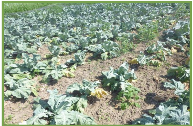
Photos (© PCG et Inagro): Volume des plantes hétérogène et plants de chou-fleur dormant attaqués par la hernie