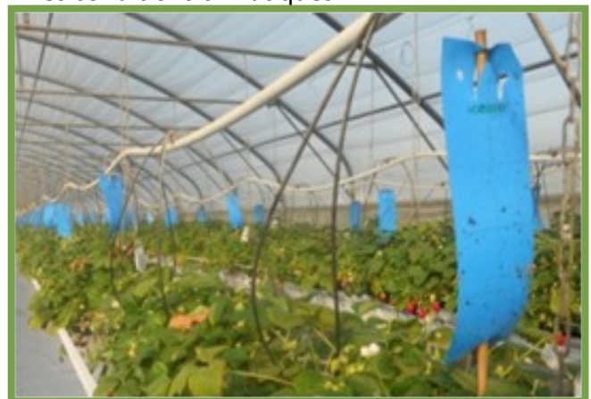
Piégeage massif (panneaux bleus englués)