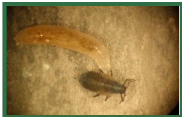
Etude de la biologie de Thaumatomyia , mouche prédatrice des pucerons des racines.