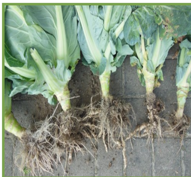
Échelle de gauche à droite: 5 = aucun dégât ; 1 = dégâts nombreux

Au niveau de la fertilisation, 700 kg/ha de Patentkali (30 %) ont été épandus le 28 mai. Le 12 juin, 500 kg/ha de nitrate d'ammonium (27 %), ont été épandus par bandes.