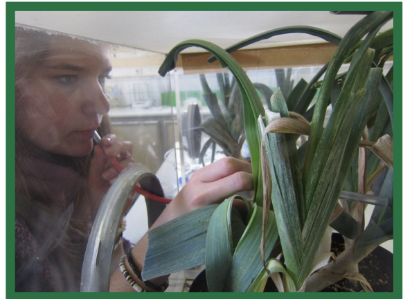
Etude de l'efficacité de produits naturels sur le thrips