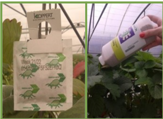
Lâcher d'auxiliaires: installation de sachets d' A. swirskii et bouteille en vrac d' A. cucumeris

Afin de mettre en place la PBI, deux sites référencés (CAR et FREDON) en production de fraises hors sol ont été suivis et des notations ont été réalisées au fur et à mesure de la saison. Sur le site expérimental de la FREDON, deux tunnels ont été mobilisés et suivis : un tunnel « témoin » mené suivant une lutte conventionnelle établi par le producteur et un tunnel « PBI » conduit suivant la stratégie de PBI (lâchers et piégeage massif). Un troisième site (Inagro) était prévu mais les populations de thrips étant inexistantes, aucun lâcher ni aucune notation n'ont eu lieu. Afin de suivre l'évolution des thrips, les notations hebdomadaires se sont déroulées sur 25 fleurs réparties dans chaque tunnel. Selon l'évolution du ravageur, des lâchers d'auxiliaires ( Amblyseius cucumeris et A. swirskii ) ont été effectués durant toute la saison. Ces deux espèces d' Amblyseius ont effectivement été introduites de manière complémentaire, dans l'optique d'ajuster au mieux la protection selon les conditions climatiques.