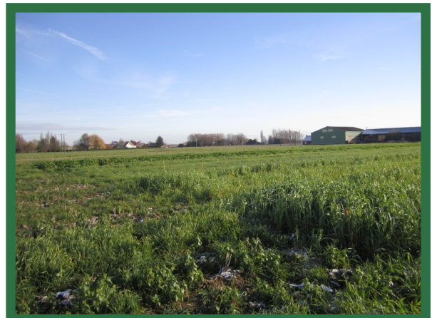
Etude de l'impact des plantes de couverture sur le sclérotinia