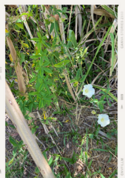
Merremia aegyptia - mi-avril 2024

⚠️ Présence importante de Merremia aegyptia + Panicum maximum + Amaranthe Attention la B69.566 est particulièrement sensible aux attaques de rongeurs (écorce tendre). A surveiller.