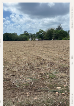
Parcelle récoltée - mi-avril 2024

⚠️ Présence importante de Merremia aegyptia + Vigna unguiculata + Panicum maximum Nombreuses attaques de rats