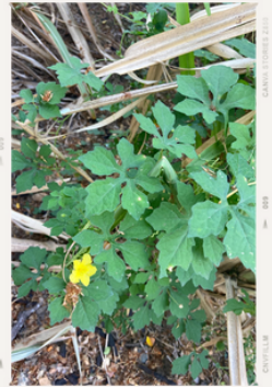
Momordica charantia - fin mars 2024

⚠️ Apparition de Calopogonium mucunoides , Malachra acefolia et Momordica charantia : à surveiller Attention la B69.566 est particulièrement sensible aux attaques de rongeurs (écorce tendre). A surveiller.