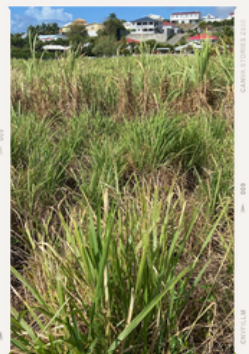
Panicum maximum - fin mars 2024

⚠️ Présence importante de Merremia aegyptia + Panicum maximum