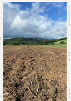
Post hersage - mi-avril 2024

Rien à signaler sur les mois de mars et d'avril 2024 sur l'enherbement, les maladies et les rongeurs.