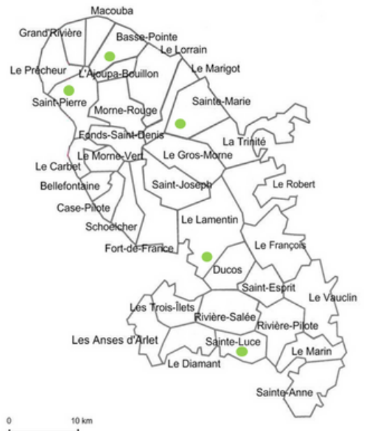
● Localisation des parcelles du réseau de surveillance

Fréquence : 2 observations par mois et par site tous les 15 jours.