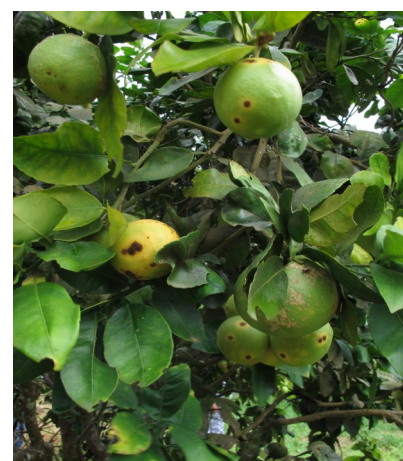
Chancre citrique sur fruit