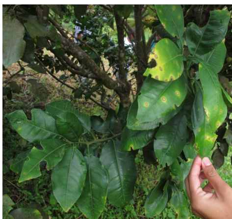
Chancre citrique sur feuilles

A cette date, le chancre citrique est localisé dans le Nord de la Martinique dans les communes suivantes : l'Ajoupa-Bouillon, le Lorrain, le Morne-Rouge, Saint-Pierre, le Marigot et Sainte-Marie (voir carte de répartition jointe).