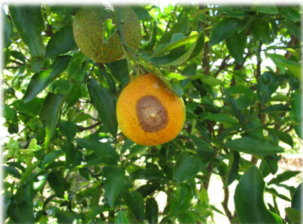
Dégâts de papillons piqueurs de fruits sur agrumes