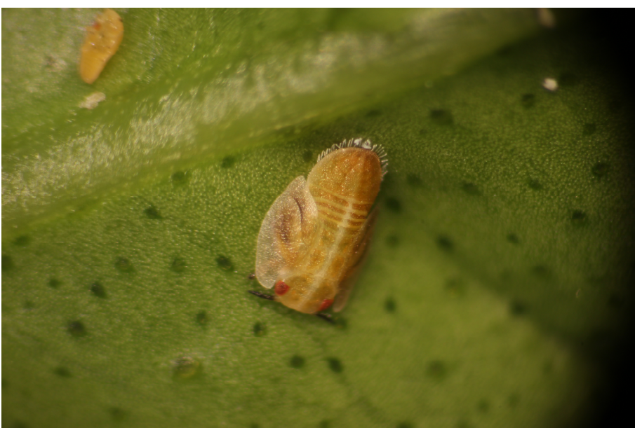
Larve du Psylle asiatique des agrumes

Tamarixia radiata est une minuscule guêpe parasitoïde qui s'attaque exclusivement à Diaphorina citri . Elle pond ses œufs dans les larves de psylles qui finissent par mourir. La présence de cet auxiliaire permet de limiter de façon significative les populations de psylles grâce à un taux de parasitisme élevé en Martinique.