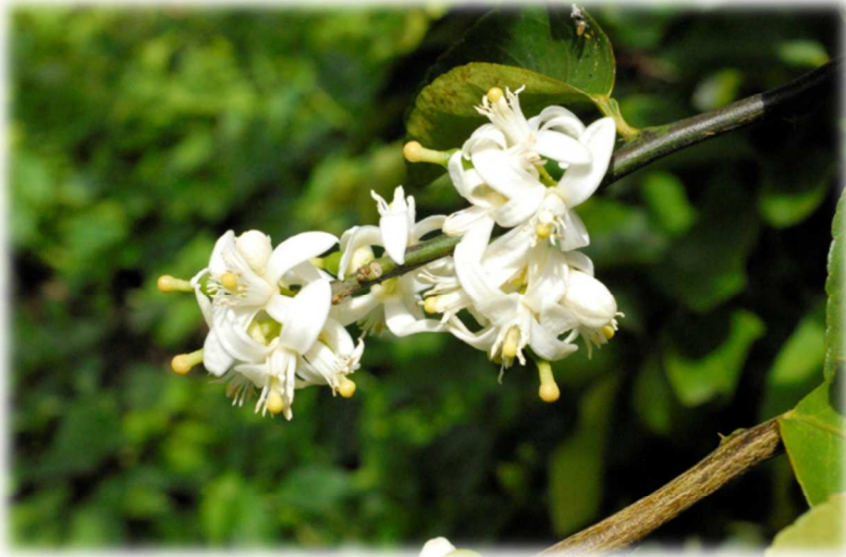
Fleur de lime de Tahiti

Répartition spatiale des parcelles d'observations et des cultures suivies :