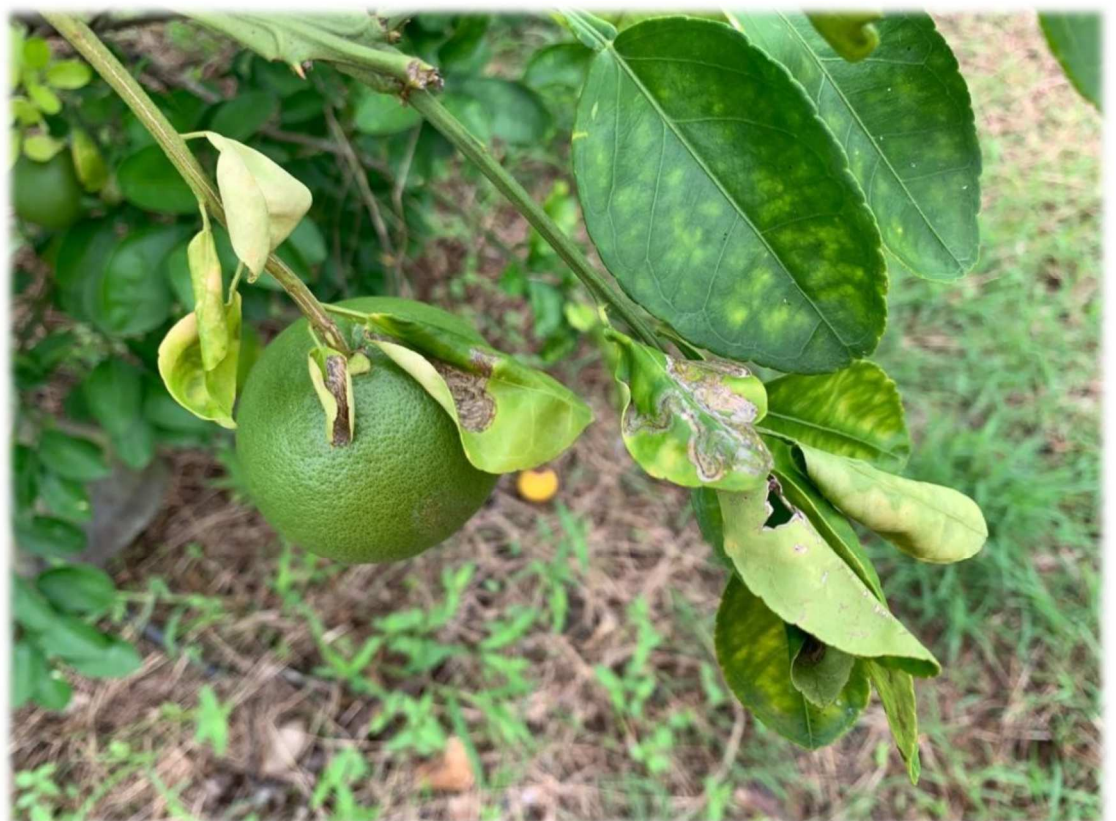
Mineuses des agrumes sur feuilles d'agrumes