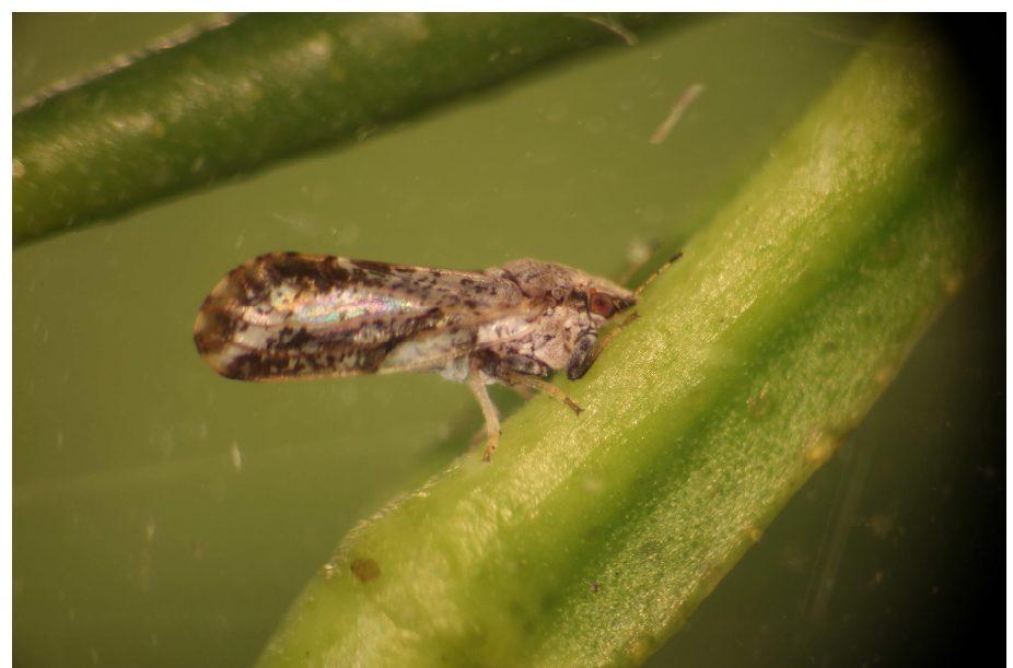
Diaphorina citri adulte