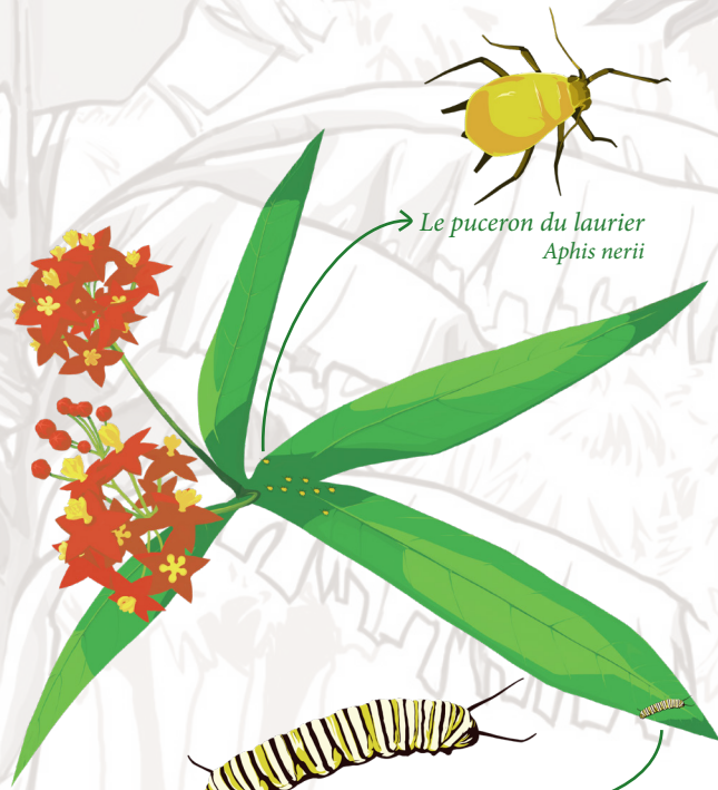
Le puceron du laurier Aphis nerii

Services : Ressource annuelle pour les prédateurs et parasitoïdes de chenilles et pucerons.