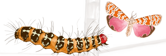
La chenille Utetheisa ornatrix