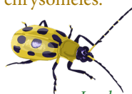
La chrysomèle Diabrotica fucata

Apport azoté du sol. Favorise les réseaux mycorhiziens.