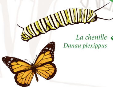
La chenille Danaus plexippus