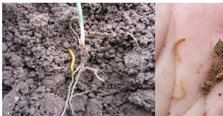
Larves de taupin (CA 14)

Quelque perte de pieds liée à la présence de larve de taupin sont observées dans une parcelle du Calvados.