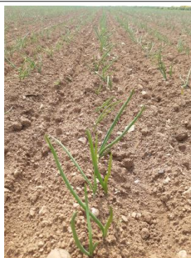
Oignons bulbilles (CA 14)

Bon état sanitaire des parcelles observées.