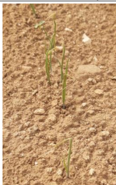
Oignons de semis