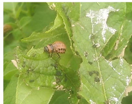
Larve de doryphore

Il n'y a plus de risque. D'autant plus que les parcelles risquent d'être prochainement défanées et que le volume foliaire est maintenant élevé.