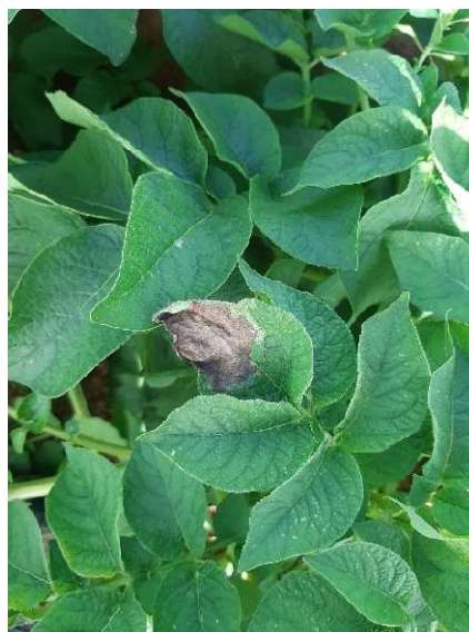
Tache de mildiou (Chambre d’Agriculture de Normandie)