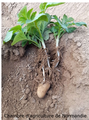
Chambre d'agriculture de Normandie