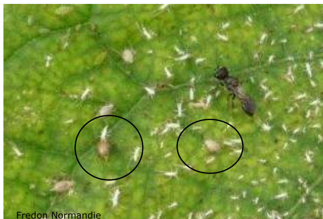
Micro-hyménoptère parasitoïde et pucerons parasités