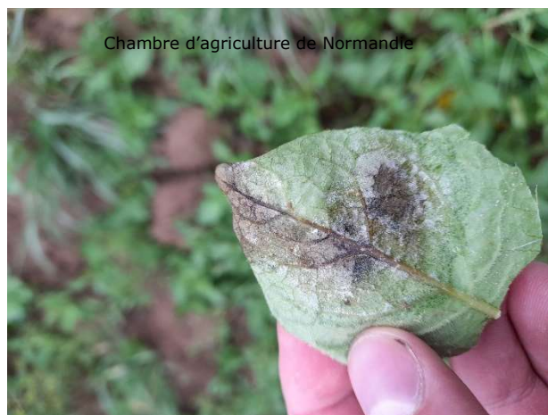
Taches de mildiou observées sur tas de déchet