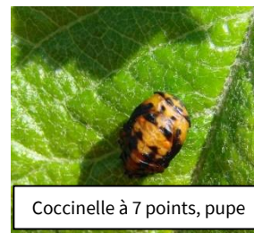
Coccinelle à 7 points, pupa