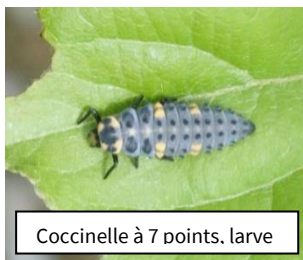
Coccinelle à 7 points, larve