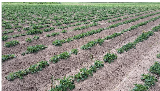
Parcelles de pomme de terre en cours de levée hétérogène, secteur Seine-Maritime.