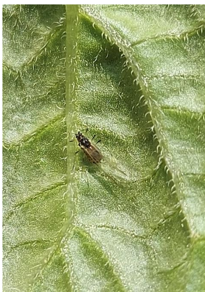
Puceron ailé, Myzus persicae (Chambre d'agriculture de Normandie)

Quel que soit le secteur, la présence de pucerons a été observée sur les jeunes feuilles. Aucune colonie n'a encore été vue.