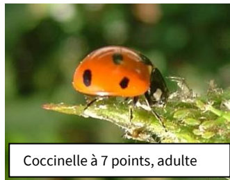
Coccinelle à 7 points, adulte