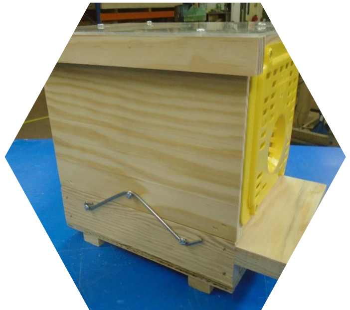
Piège nasse à grilles Néoppi jaunes