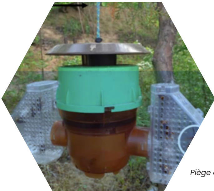
Piège coréen à ailes

Renouveler l'appât au plus tous les 8-10 jours, en laissant quelques frelons vivants à l'intérieur du piège, les phéromones attirent les frelons et repousseraient les autres insectes.