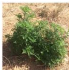
Stade végétatif Mai-Juillet