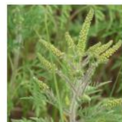
En fleur Août-Septembre