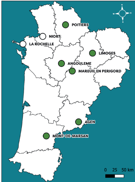
Sources : © IGN-GEOFLA ® (2014) ; données RNSA (2024) Cartographie : FREDON NA, 2024