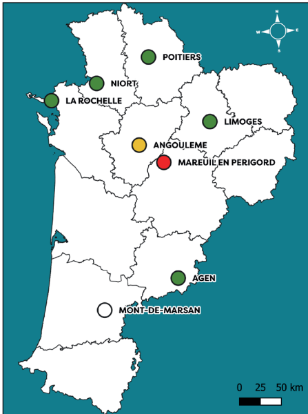
Cartographie : FREDON NA, 2024

Certaines parcelles se retrouvent littéralement infestées par la présence de l'ambroisie, au détriment des cultures présentes (voir photo en bas de page)