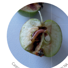
Carpocapse du pommier - FREDON NA