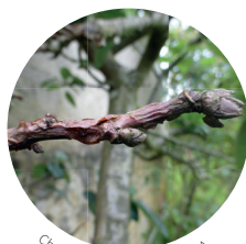
Chancre à nectria