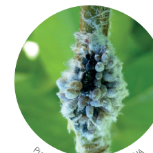
Pucerons lanigères - FREDON NA