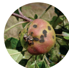
Tavelure - FREDON NA